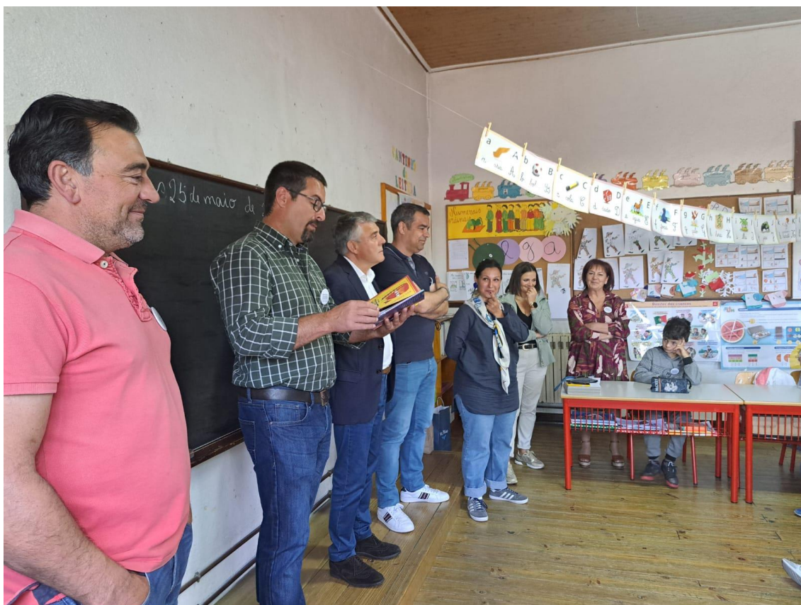
JARDIM DE INFÂNCIA E 1.º CICLO DORNELAS