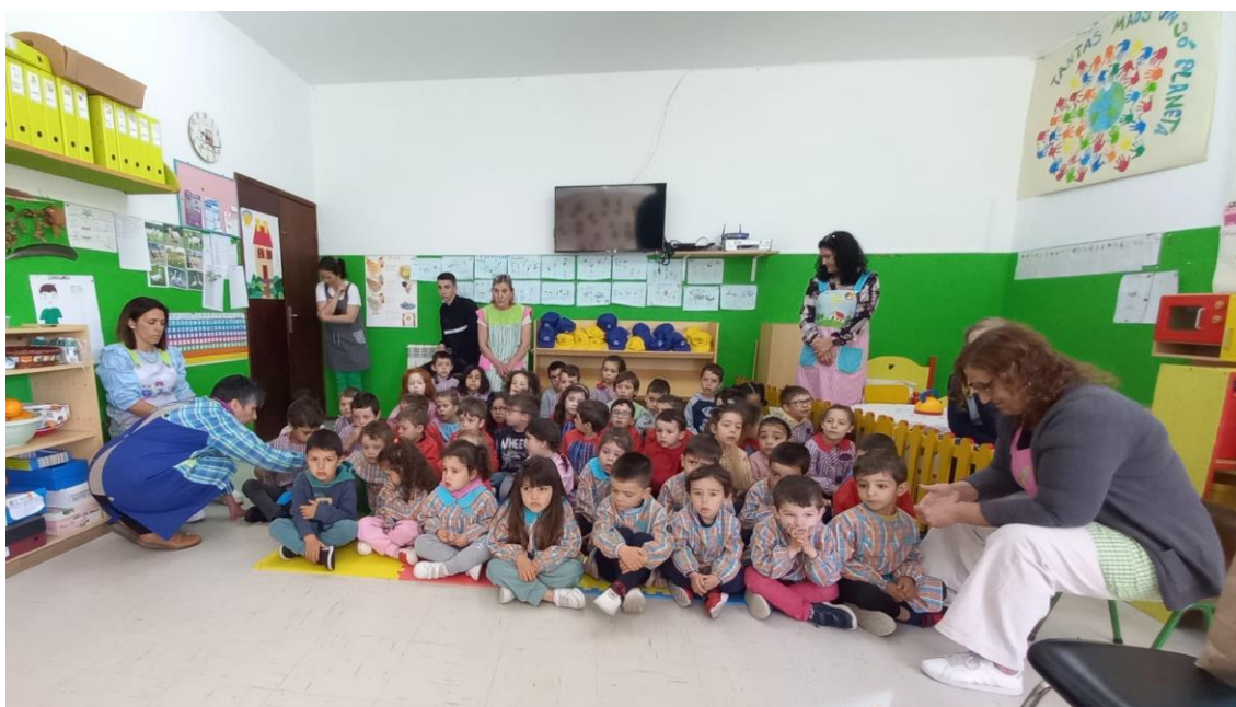
JARDIM DE INFÂNCIA AGUIAR DA BEIRA