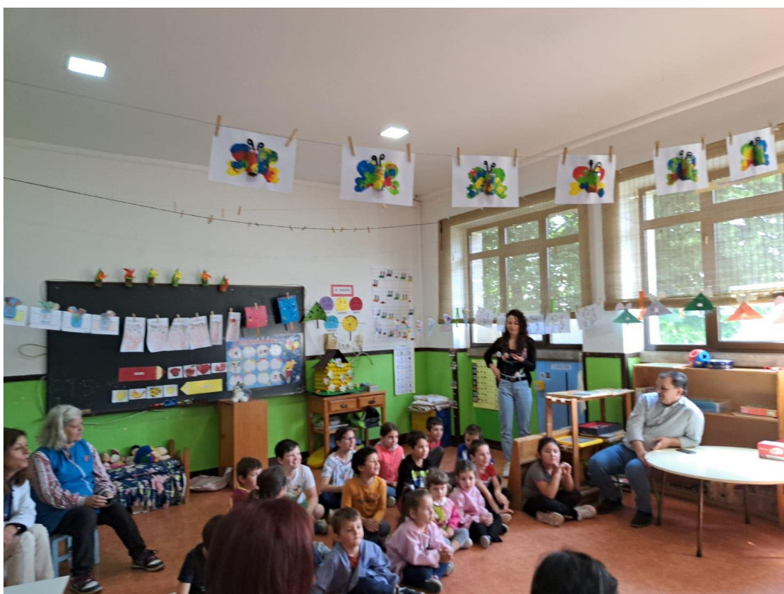
JARDIM DE INFÂNCIA E 1.º CICLO PENAVERDE