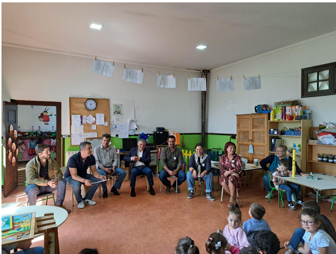
JARDIM DE INFÂNCIA E 1.º CICLO PENAVERDE