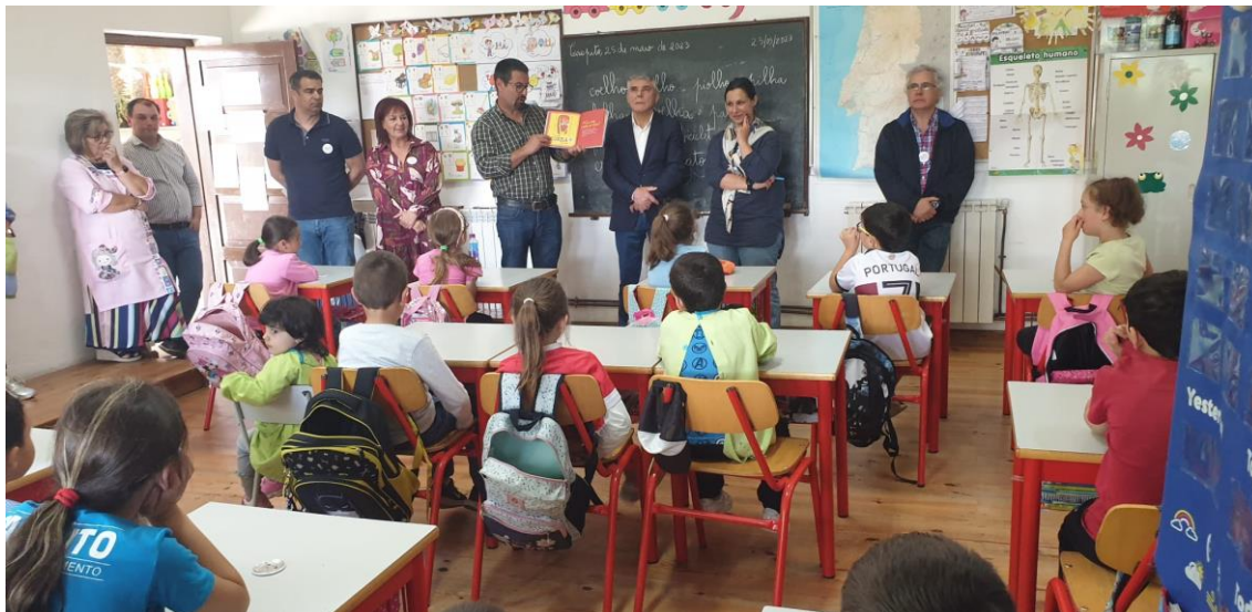
JARDIM DE INFÂNCIA E 1.º CICLO CARAPITO