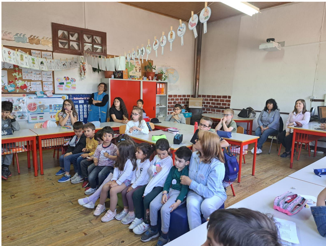
JARDIM DE INFÂNCIA E 1.º CICLO DORNELAS