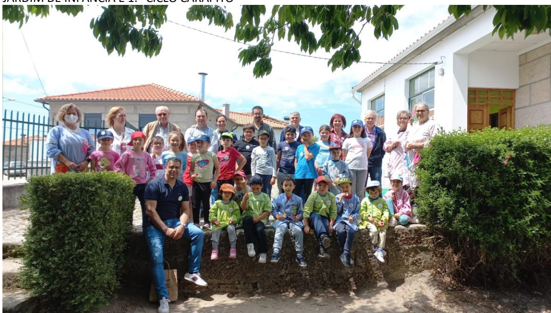
JARDIM DE INFÂNCIA E 1.º CICLO CARAPITO