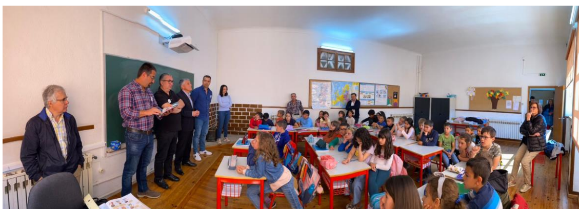
1.º CICLO AGUIAR DA BEIRA